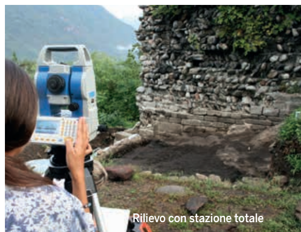
Rilievo con stazione totale

Caratterizzato da spesse murature, tetto in lastre di pietra e pavimento ligneo, esso risulta costruito sulle tracce di più antiche strutture in legno, databili all'XI secolo.