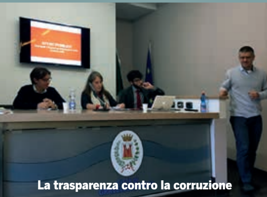
La trasparenza contro la corruzione