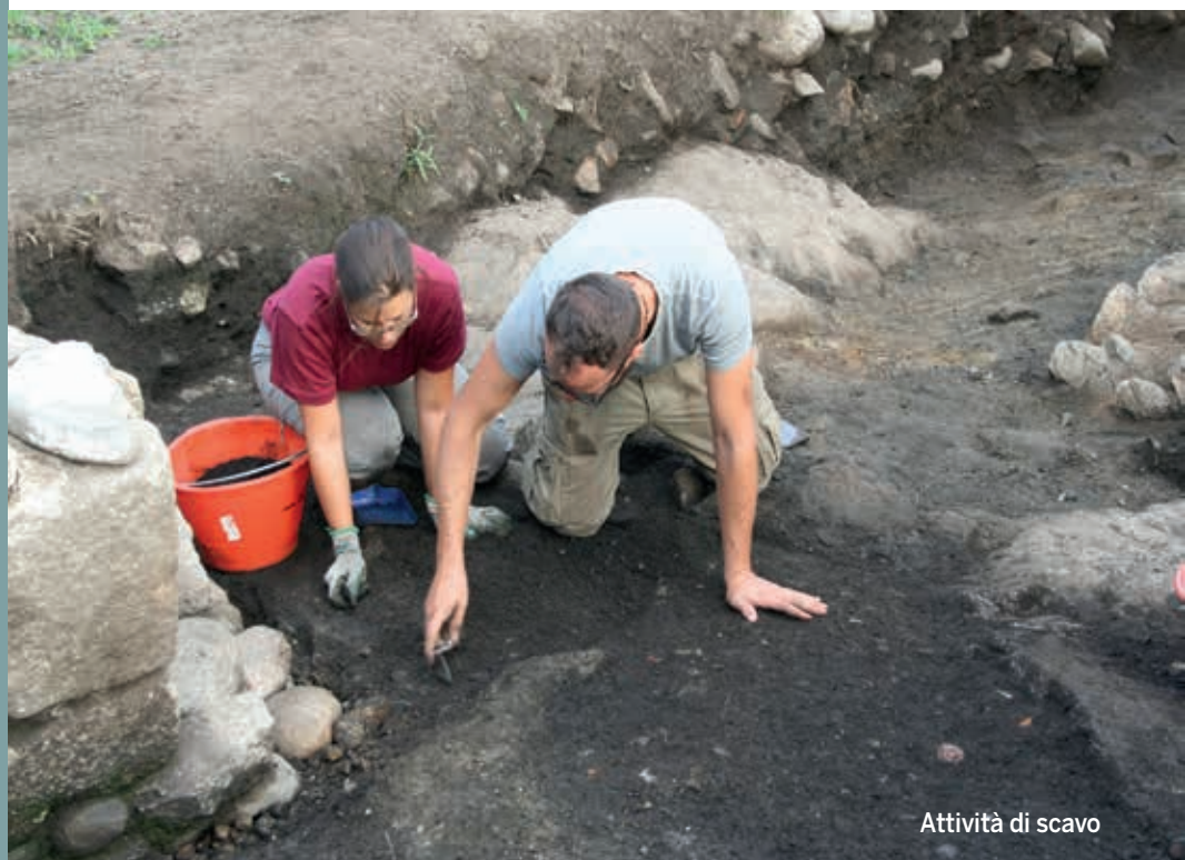
Attività di scavo