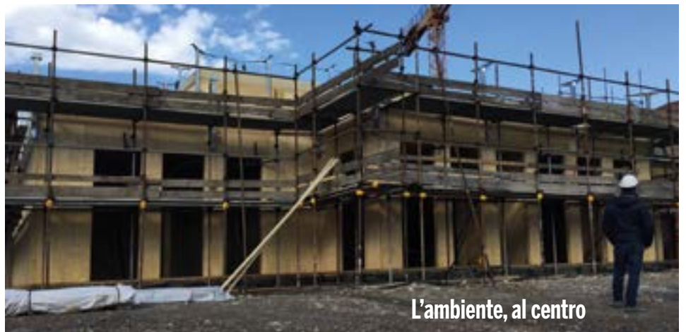
L'ambiente, al centro

E' in corso di progettazione, da parte dell'Ufficio Tecnico Comunale, un insieme di interventi di sistemazione straordinaria di