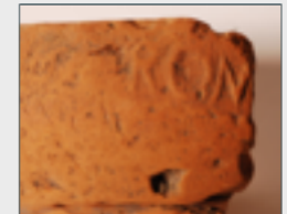
Sceau ROM (—) sur le bord d'une amphore Dressel 6B

À partir de la fin de la République romaine, se crée un système intense de marché organisé sur des voies maritimes et fluviales précises, plus sûres et rapides par rapport aux voies terrestres. Grâce à de nombreuses importations en provenance de Padanie et de la Méditerranée (en particulier adriatique et orientale), Gravellona Toce s'insère dans un système basé sur l'axe lié au Pô et aux voies hydriques exploitées dans le Tessin et la région de Verbano. Cependant, les apports de la Méditerranée méridionale dans l'Antiquité tardive ne manquent pas.