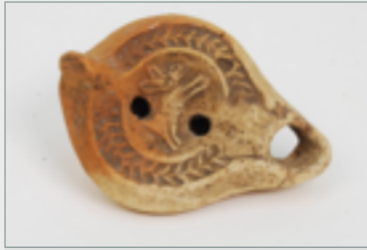
Lampe à huile d'imitation africaine

Dessin autographe de Felice Pattaroni relatif à la tombe infantile 1 bis