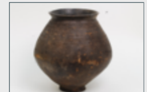
Urne cinéraire du 7ème siècle avant J.C.